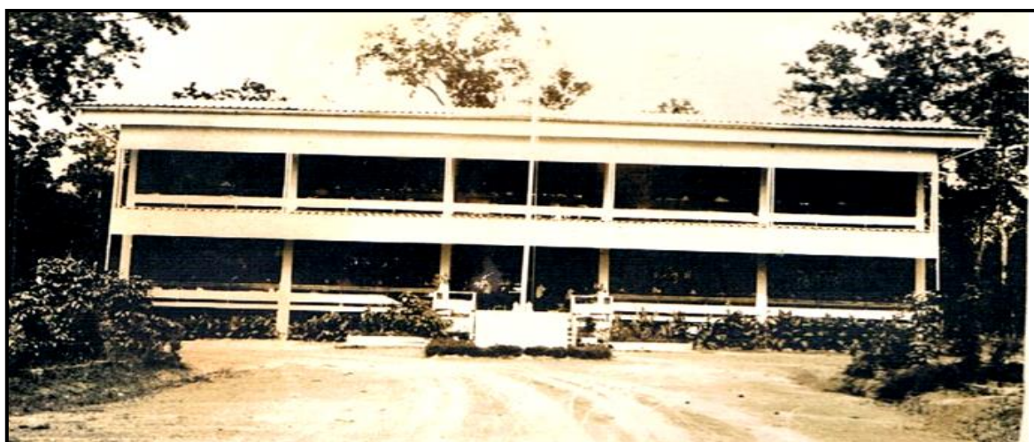
(อาคาร 2 ชั้น จำนวน 4 ห้องเรียน) ตึกอำนวยการปัจจุบัน

โรงเรียนมัธยมวานรนิวาส เดิมบรรดาพ่อค้า ข้าราชการ ชาวบ้านอำเภอกวนรนิวาส มีความประสงค์ ให้มีโรงเรียนมัธยมประจำอำเภอ จึงได้ร่วมใจกันบริจาคทุนทรัพย์เป็นจำนวนเงิน 26,000 บาท สมทบทุนปลูกสร้างอาคารเรียน ในที่สุดได้รับอนุญาตให้ก่อตั้งโรงเรียนขึ้นในปีการศึกษา 2509 ปีแรกยังไม่มี อาคารเรียนจึงอาศัยอาคารเรียนของโรงเรียนบ้านวานรนิวาส (ประถมศึกษาตอนปลาย) สังกัดกรมสามัญศึกษา เป็นที่เรียนจนถึงปีการศึกษา 2510 จึงได้ย้ายเข้ามาเรียนที่อาคารเรียนก่อสร้างขึ้นใหม่